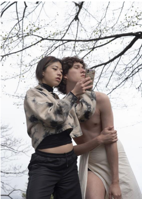
«Guardare l'utopia»